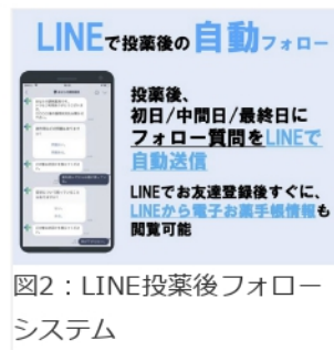
図2：LINE投薬後フォローシステム

LINEを使った投薬後の自動フォローの仕組みは、患者に薬局のLINEアカウントを友達登録してもらい、その後、薬剤師が処方せんの内容を電子お薬手帳に登録すると、そのデータをもとに、患者の服薬期間が自動判定され、初日・中間日・最終日にメッセージが自動送信されることになる。